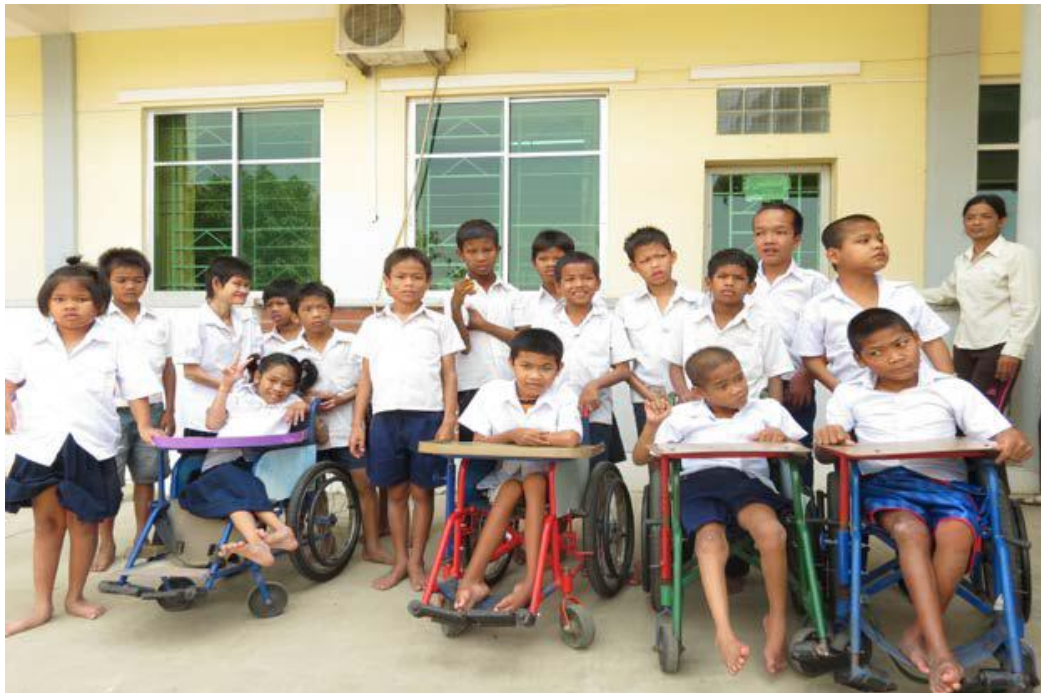
De Rabbit School